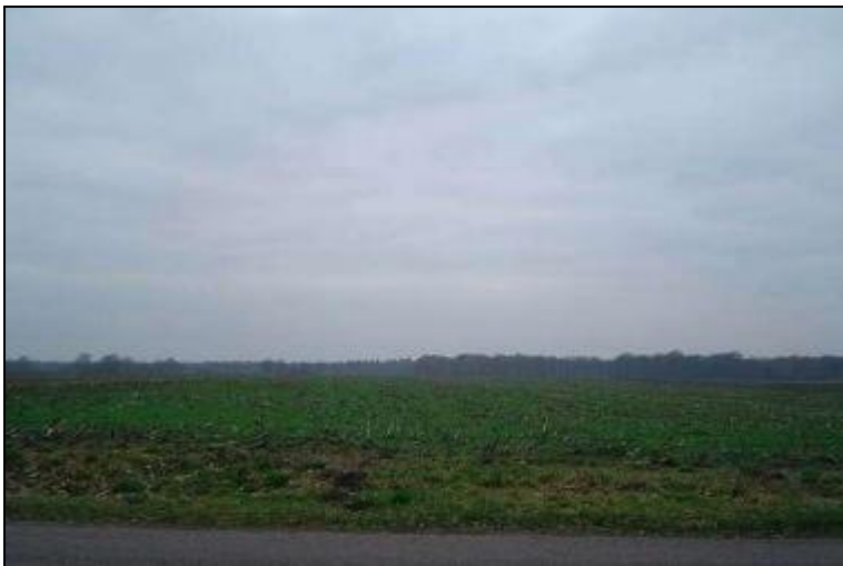
Het afwerperterrein in Stegeren ziet er nu zo uit.