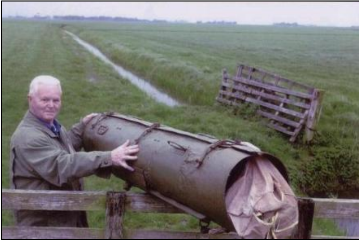
container gebruikt bij een dropping

Hoe zo'n dropping ongeveer ging lees je in het verhaal hieronder.