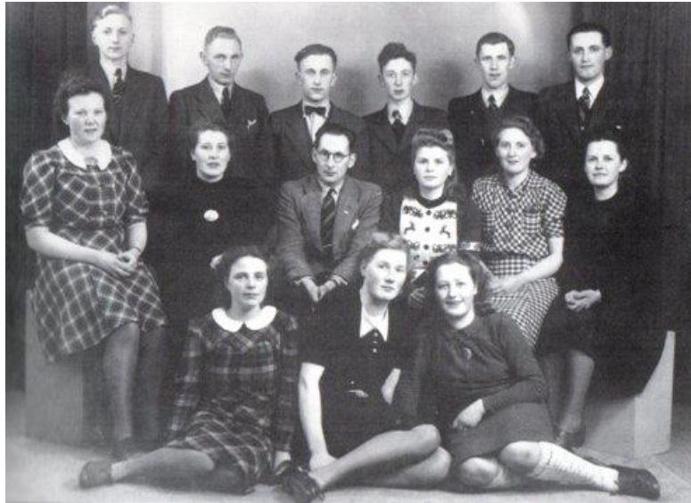
Personeel van het distributiekantoor in Gramsbergen