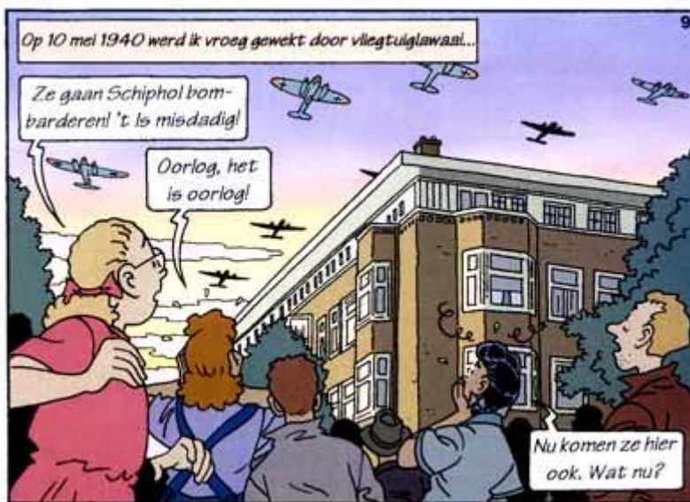
Een plaatje uit 'De Ontdekking.'

Misschien ken je het stripboek 'De Ontdekking' of 'De Zoektocht.' Of misschien heb je 'Van Nul tot Nu' gelezen. Je kunt veel leren van een stripverhaal.